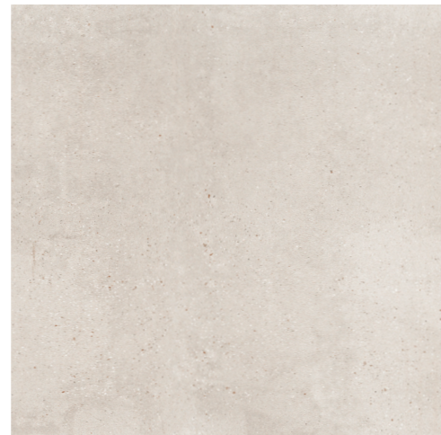
BOTTEGA CALIZA 80*80

El pavimento es continuo, porcelánico de gran formato, tanto para el interior y exterior (antideslizante) se utiliza el mismo modelo. De esta forma salón y terraza se integran en un espacio visualmente. Además, la carpintería de aluminio va embutida en la unión de salón a terraza.