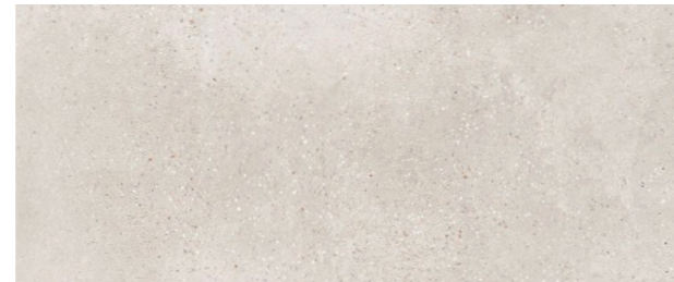
BOTTEGA CALIZA 45 x 120 cm