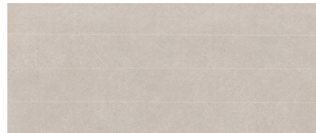
SPIGA 45 x 120 cm