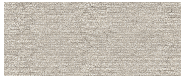
TRECCIA 45 x 120 cm